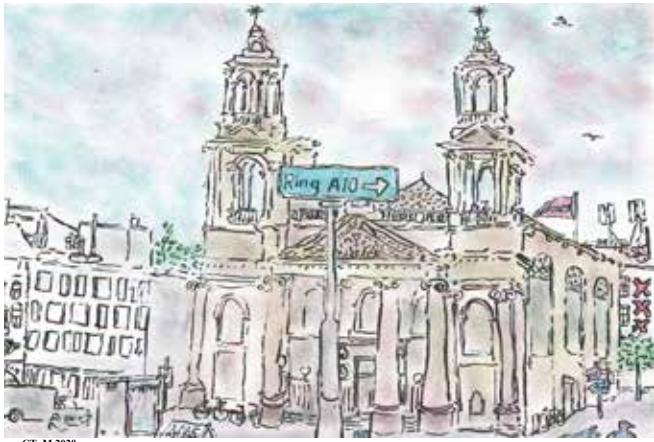
Mozes en Aäron kerk - Waterloooplein

Bewonersraad Groot Waterloo met Bewonersraad Nieuwmarkt Tijdelijk enkel digitaal www.bewonersraad1011.amsterdam