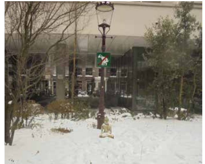
Het Feduzziplantje. Een oase van rust en meditatie tussen de Derde Weteringdwarsstraat en de Nieuwe Weteringstraat. Sinds kort is vlakbij een boekenruilplankje te vinden veilig droog onder de luifel naast de ingang van de Aldi.