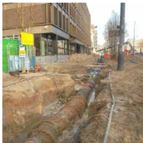
Piano/vleugel Sarphatistraat 1

Pas nu bemerk ik, dat de brug tussen Westeinde en Van Woustraat een naambordje heeft. Eureka! Dat is de juiste oplossing: Plaats op de brede brug een paar comfortabele bankjes voor de gepensioneerden en wie al niet. Van daaraf is het echte spektakel magnifiek te zien. Hijskraan, dekschuiten, beunbakken en de mannen van New Horizon zullen t/m 25 juni hier flink in de weer zijn met het ontakelen van de ronde toren. En het afvoeren van grote brokstukken over de Singelgracht.