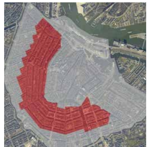
Weesperstraat midden in Unesco Werelderfgoed

De Pilot Knip gaat alleen over het weren van het doorgaande verkeer door de stad. Alle locaties in de binnenstad blijven bereikbaar, al zal er soms een andere route nodig zijn. En het doorgaande verkeer kan de ring pakken.