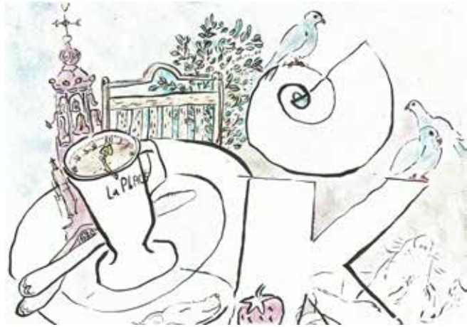
CTM 2020 Munttoren gezien vanaf balkon La Place

Tussen Prinsengracht, Westermarkt, Raadhuis- en Paleisstraat, Dam, Rokin, Munt, Singel, Koningsplein en Heren- en Leidsegracht