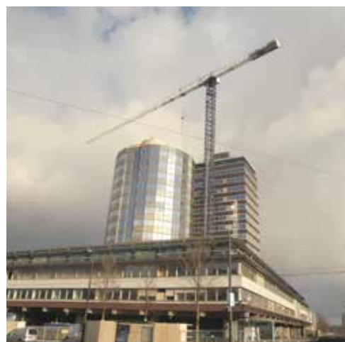
De ontmanteling is begonnen

Maandag vertelt een opzichter dat de werkploeg pas woensdag komt. Ze zijn nu bezig op de Reguliersgracht. Niet alle zware bakken hoeven opzij. Als ze er maar goed bij kunnen. Dat valt dan wel weer mee. De spuitploeg blijken geschikte kerels. Een buurman betreurt de vernietiging van de unieke schattige muurbloempjes. En dan weer alles terugzetten en handen wassen.