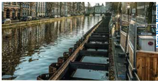
Bouwkuijmethode met damwanden bij de Kloveniersgracht