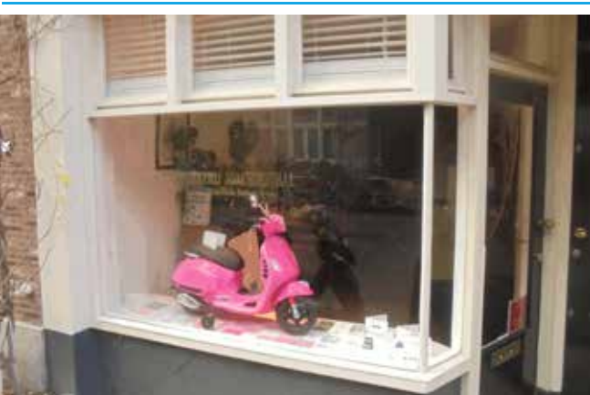
Drukkerij Joachimsthal nu in de Kerkstraat 389