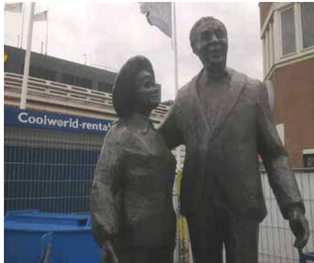
Corrie Vonk en Wim Kan pronkten jarenlang op het Leidseplein. Later werd de beeldengroep naar Kuddelstaart verbannen. Nu flaneren ze over de boulevard van Scheveningen nabij Circustheater en Kurhaus met uitzicht op zee.