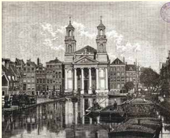
Waterlooplein, voorheen Leprozengracht, gezien vanaf de Amstel naar de Mozes en Aäronkerk. Houtgravure van Joh. Walter uit 1873

waar nu het ruimtelijk effect is weggehaald door er allerlei objecten als perkjes en waterpartijen in te plaatsen of om te vormen tot horecaruimte. Pleinen zijn geen bouwlocatie en bebouwing op een plein tast dan het ruimtelijk beeld aan.