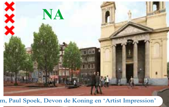
Foto's: Guido Frankfurter, Anne Noordijk, Marijke Storm, Paul Spoek, Devon de Koning en 'Artist Impression'

Vragen over de herinrichting: omgevingsmanager Ron van Leeuwen : r.van.leeuwen@amsterdam.nl Vragen over de Waterloopleinmarkt: markt bureau@amsterdam.nl