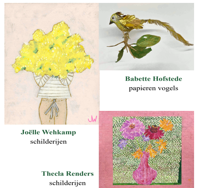
Babette Hofstede papieren vogels