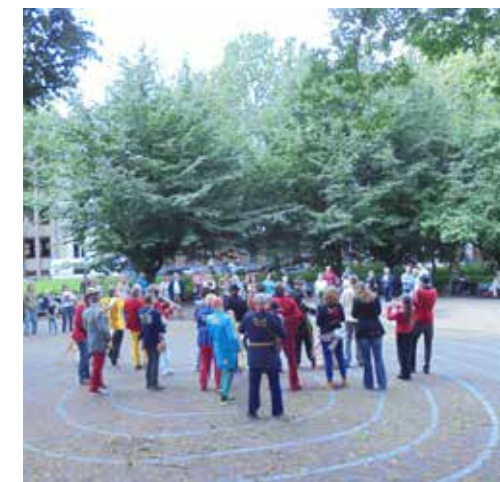
Fanfare Toeters & Bellen

08-01-2021. Dossiernummer Z2021-C000113; Dit is een kennisgeving. In een latere fase van de procedure kunt u een zienswijze indienen, of bezwaar maken. Bij een reguliere procedure geldt, dat een belanghebbende binnen 6 weken schriftelijk bezwaar kan indienen, nadat het besluit kenbaar is gemaakt aan de aanvrager. Bij een uitgebreide procedure kunnen zienswijzen worden ingediend, vanaf het moment dat een ontwerpbeschikking is gepubliceerd.