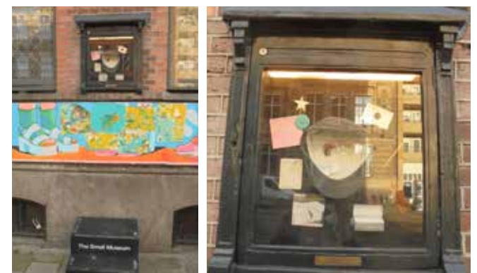
The small museum Paradiso t/m 7 maart Martin La Roche