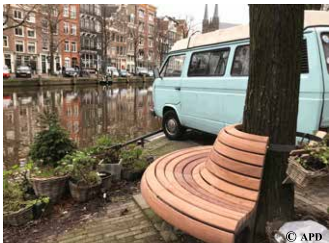
Half rond bankje op het Singel waarvan er meerdere geplaatst zijn. In elk geval goed tegen het parkeren van fietsen tegen de bomen.