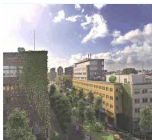
verbeelding: Ruben Vroman, BoemanFX

De verkeersweg splitst de buurt, de Weesperstraat doorsnijdt de woonwijken aan beide zijden. Mensen vluchten snel uit de straat weg als ze er niet moeten zijn. In en om de straat zitten pareltjes met stille plekken, groen, culturele voorzieningen, waterkanten, monumenten. Maar in de Weesperstraat zelf merk je dat niet. Wat je wel merkt zijn de vele studenten en onderwijsinstellingen in de straat, maar de verkeersstraat roept geen warm beeld op van een attractief studentenleven. Bewoners en het samenwerkingsverband Knowledge Mile werken op veel manieren om de sfeer in en om de straat te veranderen, met groenplannen en andere inrichtingen. Maar de echte doorbraak moet komen door minder verkeer.