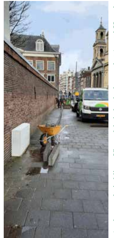
Aanleg geveltuin bij mr. Visserplein in het kader van het Amstel-IJ-park

De ambitie van het Amstel-IJ-park reikt mijlen verder. Elke gevel- of daktuin, plantsoen of snipper groen is meer dan welkom.